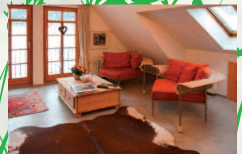
Les- und Medienecke