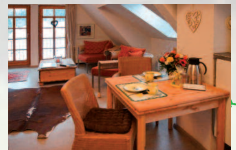
Ess- und Arbeitsplatz