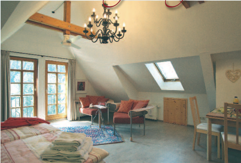
Schlaf-, Wohn- und Essbereich

Die hochwertige Küchenzeile mit allem was notwendig ist, dient nicht nur zum Frühstück, sondern hier können sie auch ein reichhaltiges Menu zaubern.