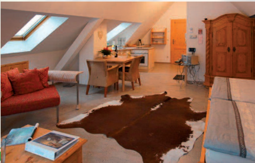
Schlaf-, Wohn- und Essbereich

Genießen sie ihre wertvolle Urlaubszeit in dieser gemütlichen Atmosphäre mitten in der Natur um Ruhe und Entspannung in Körper, Geist und Seele einkehren zu lassen.